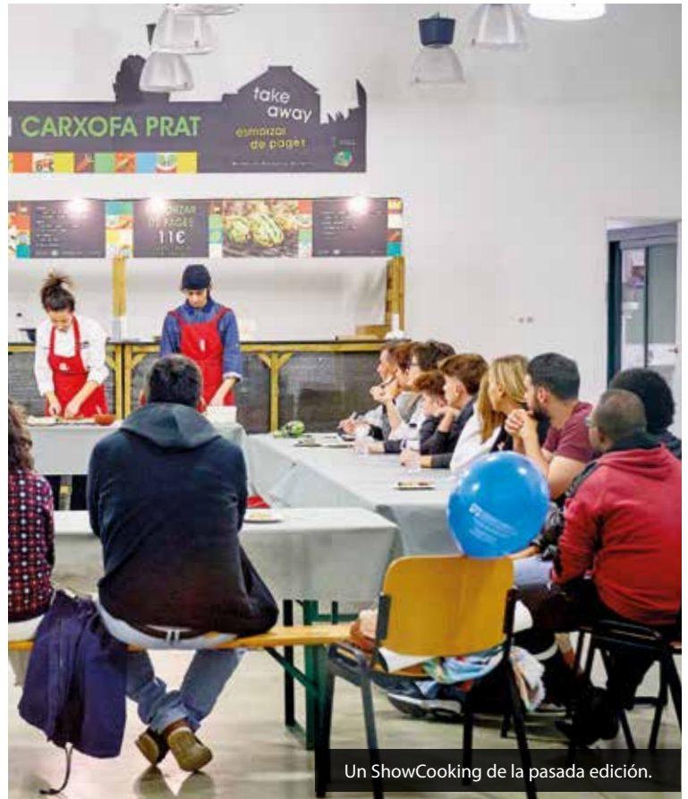
Un ShowCooking de la pasada edición.

La Granja de la Ricarda acogerá un año más el Espai Gastronòmic de la Fira, que centrará su oferta en el Pota Blava y la Carxofa Prat y que ofrecerá el tradicional desayuno de pagès , el plato de Pota Blava de la Fira y el Take Away Pota Blava.