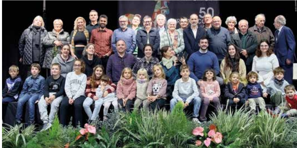
Criadors i criadores participants a la Fira Avícola de l'any passat.

Però seguim aquí, som una realitat de present i sobre tot d'un incert futur on la sobirania alimentària no es pot menystenir fent projectes i malabarismes polítics per enganyar la gent, ampliar l'aeroport, ampliar la zona especial de protecció d'aus i presumir tots del Parc Agrari del Baix Llobregat quan ens toca ser capital mundial de l'alimentació.