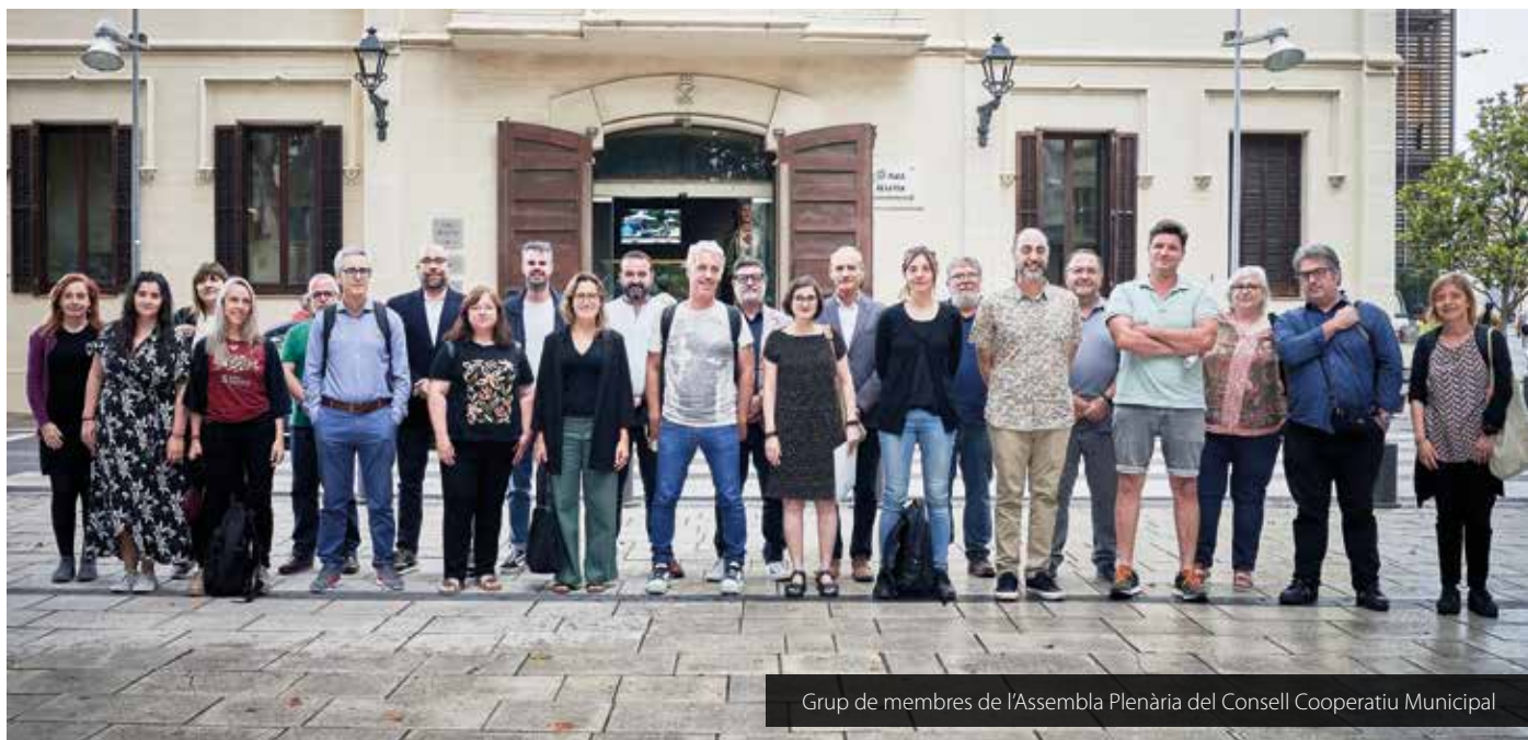
Grup de membres de l'Assemblea Plenària del Consell Cooperatiu Municipal