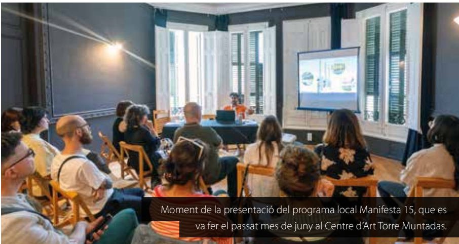
Moment de la presentació del programa local Manifesta 15, que es va fer el passat mes de juny al Centre d'Art Torre Muntadas.

La ciutadania podrà accedir amb entrada a la Casa Gomis, a la finca de la Ricarda, de manera estable durant gairebé tres mesos a la tardor