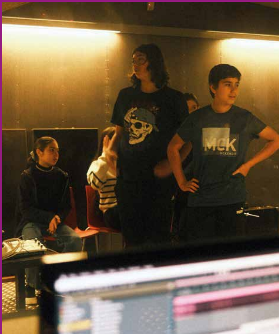
Moment de l'enregistrament del rap a l'estudi de gravació.

Trobareu el videoclip al web elprat.cat/conselldadolescents