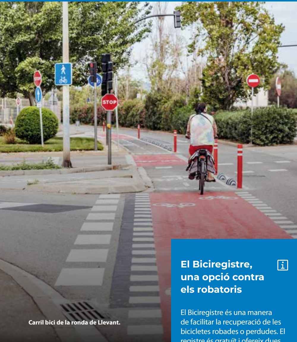
Carril bici de la ronda de Llevant.

durant les pròximes setmanes. Aquests serveis s'ampliaran properament amb nous mòduls al costat de l'estació de Renfe i a dues estacions de metro per facilitar la intermodalitat.