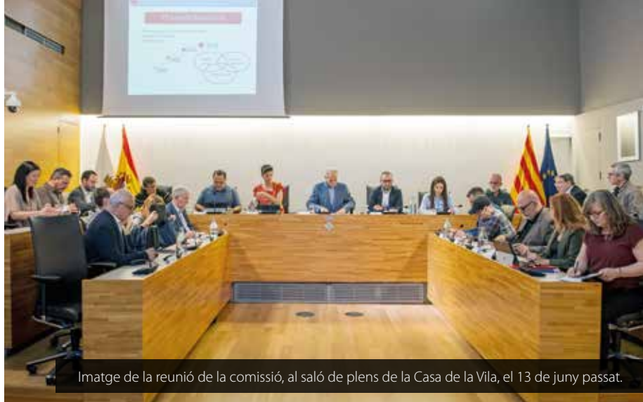
Imatge de la reunió de la comissió, al saló de plens de la Casa de la Vila, el 13 de juny passat.

Després del parèntesi que va suposar la pandèmia de covid i la posada en marxa de les mesures prioritàries per fer-hi front, ratificades pels agents econòmics i socials a l'estratègia de reconstrucció "Ara més que mai", el 13 de juny passat es va celebrar la reunió de la Comissió de Seguiment del Pacte local per a l'ocupació i l'activitat